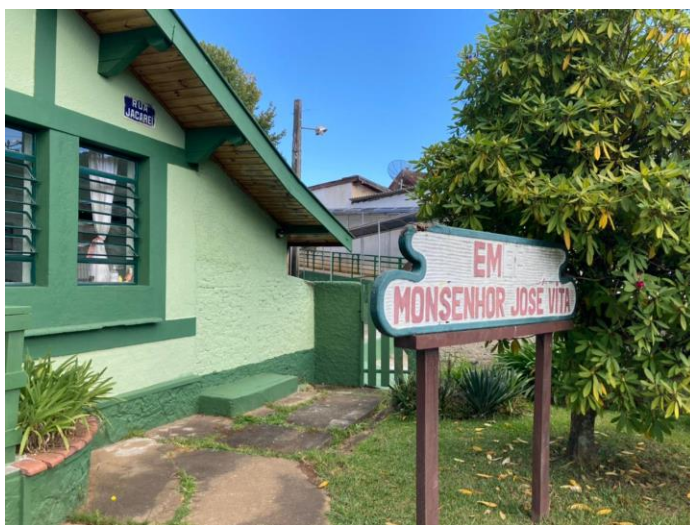
EMEF PROFª MAFALDA APARECIDA MACHADO CINTRA E EM MONSENHOR JOSÉ VITTA, AMBAS PARTICIPANTES DO PGRS.